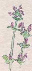
ヒメオドリコソウ