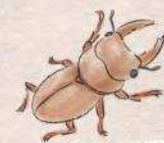
アカマシクワガタ